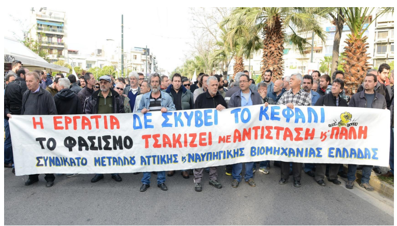
Δυναμική διαδήλωση ενάντια στην δράση της Χρυσής Αυγής.

Η μαζική πάλη του λαού και της νεολαίας σε κατεύθυνση ρήξης με το σύστημα μπορεί να απομονώσει και να ξεριζώσει τη ΧΑ και οριστικά και αμετάκλητα.