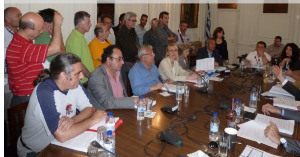
Από παρέμβαση των ταξικών σωματείων στο ΔΣ του ΝΑΤ

Το βασικό συμπέρασμα που προκύπτει για τους ναυτεργάτες, γενικότερα για την εργατική τάξη, είναι ότι στον καπιταλισμό όλες οι κατακτήσεις είναι εσφαλμένες, κάτω από τη δομολογία σπάθης του κεφαλαίου. Προϋπόθεση για σύγχρονα κοινωνικοασφαλιστικά δικαιώματα για όλους, για σταθερή δουλειά με πλήρη δικαιώματα, καθολικό δημόσιο και δωρεάν σύστημα Υγείας, είναι να πάρουν οι εργαζόμενοι στα χέρια τους τον έλεγχο και το σχεδιασμό της οικονομίας, με κοινωνικοποίηση των μέσων παραγωγής και εργατική εξουσία. Το δυνάμωμα της Λαϊκής Συμμαχίας και η ισχυροποίηση του ΚΚΕ είναι προϋπόθεση για να πάει αυτός ο αγώνας μέχρι τέλους.