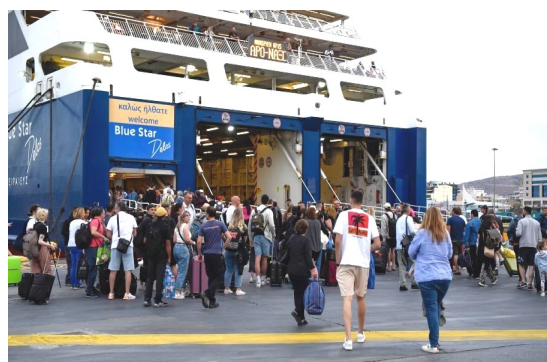
Τα ναυτεργατικά σωματεία ΠΕΜΕΝ, ΣΤΕΦΕΝΣΩΝ, ΠΕΕΜΑΓΕΝ, απευθύνουν κάλεσμα για να δυναμώσει ο συντονισμός και ο αγώνας, Εργατικών Κέντρων, συνδικάτων, φορέων, για φθηνές - σύγχρονες - ασφαλείς ακτοπλοϊκές συγκοινωνίες, ενάντια στην πολιτική των εφοπλιστών, της κυβέρνησης ΝΔ και της Ε.Ε, με κριτήριο τις ανάγκες της εργατικής λαϊκής οικογένειας, τα δικαιώματα των ναυτεργατών.»

14 Ιούλη 2023 Οι Διοικήσεις των Σωματείων