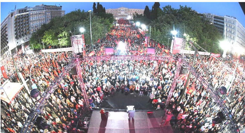
ΒΟΥΛΕΥΤΙΚΕΣ ΕΚΛΟΓΕΣ ΙΟΥΝΗΣ 2023 Εγκύριο Τμήματα: 99,83% (21.832 / 21.869) Εγγεγραμμένοι: 9.974.469 | Αποχή: 47,17% | Εγκύρια: 5.210.916 | Λευκά: 26.276 | Ακυρά: 32.200