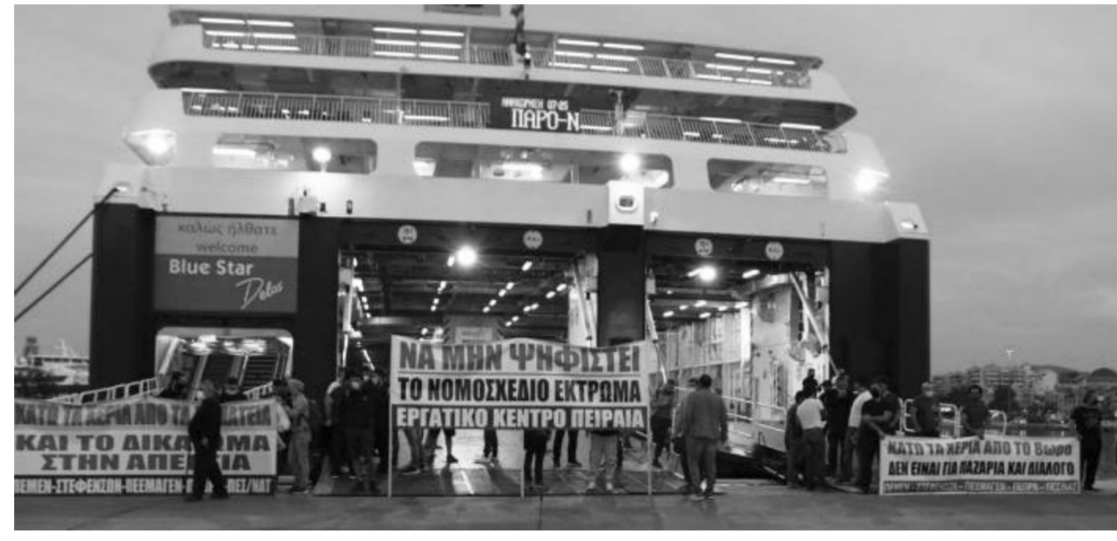
Μεγάλη - μαχητική απεργιακή συγκέντρωση και πορεία στο λιμάνι

Το νομοσχέδιο να αποσυρθεί τώρα, να πάει στα σκουπίδια, τόνισε στην ομιλία του στην απεργιακή συγκέντρωση του Πειραιά ο Λεωτέρης Μπαρμπαρούσης πρόεδρος του ναυτεργατικού σωματείου «ΣΤΕΦΕΝΣΩΝ» στις 16 Ιούνη. Μέσα στο λιμάνι κατέληξε η μεγάλη πορεία των απεργών που πορεύτηκαν στους κεντρικούς δρόμους του Πειραιά μετά τη συγκέντρωση που πραγματοποιήσαν νωρίτερα. Στο πλευρό τους βρέθηκαν ο Γιώργος Μαρίνος, μέλος του ΠΓ της ΚΕ και βουλευτής του ΚΚΕ, και η Διαμάντω Μανωλάκου, μέλος της ΚΕ και βουλευτή της ΚΚΕ.