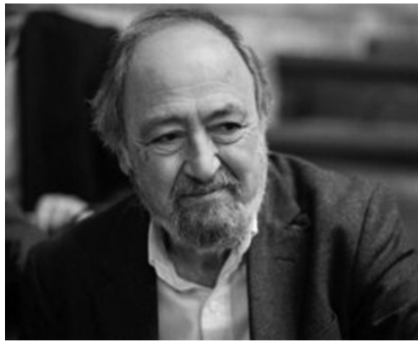
Γιώργος Μαρινός, Ναυτεργάτης, Μέλος του Π.Γ. της ΚΕ και Βουλευτής του ΚΚΕ