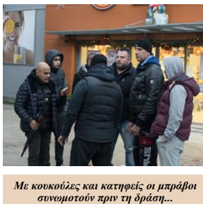
Με κουκούλες και καπέλα οι μπράβοι συνομοσπών πριν τη δράση...

Βέβαια, κάτω από την αποφασιστικότητα των εργαζόμενων, απέναντι παταγωδώς. Είναι χαρακτηριστικό πάντως το γεγονός ότι το πρωί, όταν η απεργιακή φρουρά εμφανίστηκε έξω από το σουπερ μάρκετ, η αστυνομία που «επώπτευε» το χώρο εξαφανίστηκε, αφήνοντας το πεδίο ελεύθερο στους τραμπούκους να δράσουν!