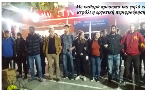
Με καθαρά πρόσωπα και νηλιά το κεφάλι η εργατική περιφρούρηση

Το ίδιο άτομο το 2014, συμμετείχε σε επεισόδια μέσα στο γήπεδο της Τούμπας, σε ποδοσφαιρικό αγώνα ΠΑΟΚ - Ολυμπιακός.