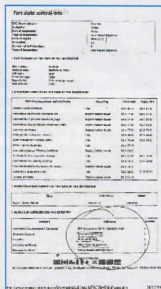
Το έγγραφο με τα αποτελέσματα του ελέγχου από τις λιμενικές Αρχές της Πάτρας

Σοβαρές ελλείψεις στους τομείς της πυρασφάλειας, αλλά και στη διαχείριση των επιβατών του πλοίου σε περίπτωση κινδύνου, εντόπισε - μεταξύ άλλων - ο έλεγχος που έγινε στο "Norman Atlantic" στις 19 Δεκέμβρη 2014, από επιθεωρητές του Κεντρικού Λιμεναρχείου Πάτρας. Το σχετικό έγγραφο, που έχει αναρτηθεί στο σύστημα "EQUASIS" ( www.equasis.org ) αποκάλυψαν τα τα-