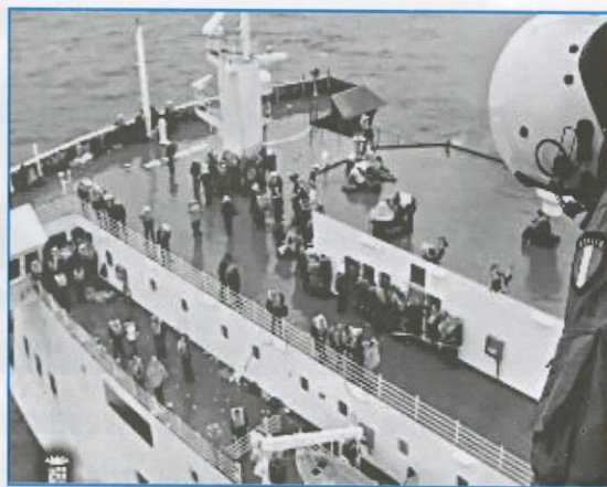
Από την επιχείρηση διάσωσης στο "NORMAN ATLANTIC"

Αυτή είναι πραγματικότητα. Οι κινήσεις που έγιναν ήταν στην κόψη του ξυραφιού, είχαν μεγάλο "ρίσκο". Οι επιβάτες και το πλήρωμα ήρθαν στη θέση του "μελλοθάνατου" και αυτό πρέπει να εκτιμηθεί αντικειμενικά, με σοβαρότητα.