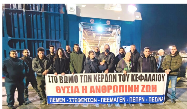
ΣΤΟ ΒΩΜΟ ΤΩΝ ΚΕΡΔΩΝ ΤΟΥ ΚΕΦΑΛΑΙΟΥ ΥΓΕΙΑ Η ΑΝΘΡΩΠΙΝΗ ΖΩΗ ΠΕΜΕΝ - ΣΤΕΦΕΝΣΩΝ - ΠΕΕΜΑΓΕΝ - ΠΕΠΡΝ - ΠΕΖΩΝ

Προειδοποιούμε ακόμα για την Κυριακή του Πάσχα, να τηρηθεί η 4ωρη διακοπή στη Σαντορίνη, σε ξενοδοχείο, για ξεκούραση του πληρώματος στο πλοίο CHAMPION JET 2».