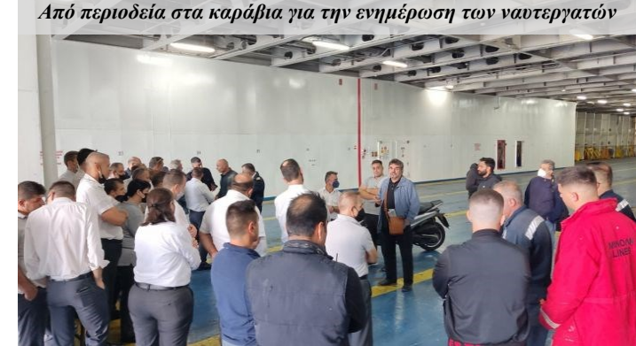
Από περιοδεία στα καράβια για την ενημέρωση των ναυτεργατών

Στοχεύει στην κατάργηση των ΣΣΕ σε όλες τις κατηγορίες πλοίων , διαμορφώνοντας εργασιακές συνθήκες με ναυτεργάτες χωρίς δικαιώματα, για να αυξάνουν οι εφοπλιστές διαρκώς τα κέρδη τους.