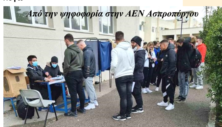
Από την ψηφοφορία στην ΑΕΝ Ασπροπύργου

Επιβεβαιώνεται πόσο ψευδπίγραφο είναι και το διαφημιστικό σποτ της Ένωσης Ελλήνων Εφοπλιστών