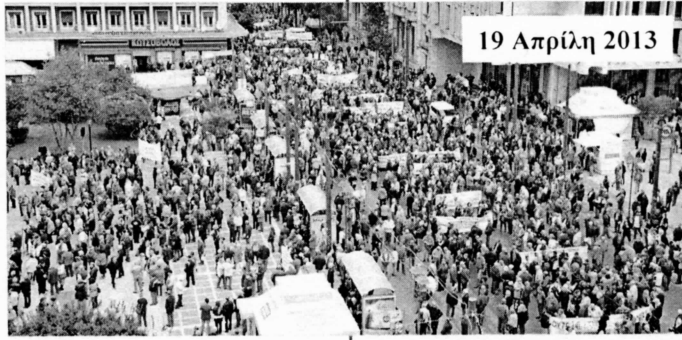
19 Απρίλη 2013

Συγκεντρώσεις έγιναν την ίδια μέρα σε πολλές μεγάλες πόλεις και στη Θεσσαλονίκη όπου αντιπροσωπεία συναντήθηκε με τον υπουργό Μακεδονίας - Θράκης, Θ. Καράογλου, ο οποίος στη γραμμή Βρούτση, ισχυρίστηκε ότι δεν θα περικοπούν άλλο οι συντάξεις.