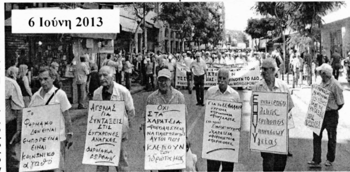
6 Ιούνη 2013