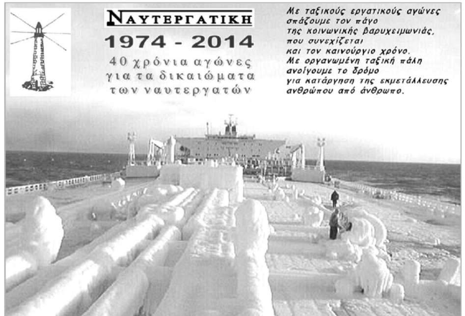
Με ταξικούς εργατικούς αγώνες απάξουμε τον πάτο της κοινωνικής βαρβαρομηνιάς, που συνεχίζεται και τον καινούργιο χρόνο. Με οργανωμένη ταξική πάλη ανοίγουμε το δρόμο για κατάργηση της εκμετάλλευσης ανθρώπου από άνθρωπο.

Η Γενική Συνέλευση εξουσιοδοτεί το Διοικητικό Συμβούλιο του ΣΤΕΦΕΝΣΩΝ, να πάρει όλα τα αναγκαία μέτρα, να εκτιμήσει και να αποφασίσει για απεργιακές κινητοποιήσεις, καλούμε όλες τις συνδικαλιστικές ενώσεις να οργανώσουν την αντίσταση και τους απεργιακούς αγώνες.