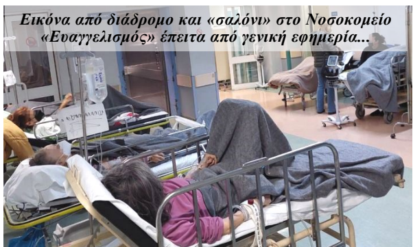
Εικόνα από διάδρομο και «σαλόνι» στο Νοσοκομείο «Ευαγγελισμός» έπειτα από γενική εφημερία...

Από παντού βγαίνει στην επιφάνεια η μεγάλη αλήθεια, ότι ο πιο «επικίνδυνος ιός» είναι ο καπιταλισμός. Ότι το κυνήγι