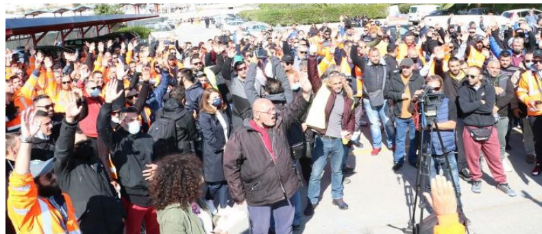
Υψηφορίες με ομόφωνες από φράσεις για τη συνέχιση της απεργίας

Στηρίζομαστε στην αλληλεγγύη που εκφράστηκε όλες αυτές τις μέρες, από εκατοντάδες εργατικά σωματεία και φορείς, από τα χειροκροτήματα και τις λιμάνι.