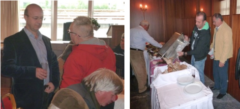
Στιγμιότυπα από τη 6εσητή και συναδελφική εκδήλωση της ΠΕΕΜΑΓΕΝ και από την καθημερινή δράση για τα προβλήματα του κλάδου, των ναυτεργατών, των εργαζομένων

στο όνομα της «ανταγωνιστικότητας», δηλαδή «βόθρα με φωχέ να μη γίνω σαν κι εσένα», όπως λέει ο λαός. Απέναντι σ' αυτό το μέτωπο ο κλάδος μας, οι ναυτεργάτες, οι εργαζόμενοι πρέπει να δυναμώσουν το δικό τους Πανεργατικό Αγώνιστικό Μέτωπο , σε συμμαχία με άλλα λαϊκά στρώματα που πλήττονται το ίδιο από την αντιλαϊκή πολιτική.