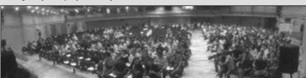
Πάνω: Πριν την αποχώρηση των αντιπροσώπων του ΠΑΜΕ Κάτω: Μετά την αποχώρηση των αντιπροσώπων του ΠΑΜΕ

Οι δυνάμεις του ΠΑΜΕ διακρίθηκαν για τη μαζική, οργανωμένη και περπατημένη παρουσία τους. Βρέθηκαν στο συνέδριο με τη συνείδηση ότι βρίσκονται σε αποστολή για την οργάνωση της τάξης τους. Η στάση τους βασίζεται στην αντίληψη ότι υπάρχει η δυνατότητα και η ανάγκη για έναν άλλο δρόμο ανάπτυξης σε όφελος του λαού, που περνά μέσα από την ταξική σύγκρουση.