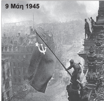
9 Μάη 1945

Είναι μορφή άσκησης της εξουσίας των μονοπωλίων, που ο Χίτλερ, ο Μουσολίνι και γενικότερα τα εθνικοσοσιαλιστικά κόμματα εξέφρασαν και εξυπνήτησαν. Ήταν και είναι η αιχμή του δόρατος της καπιταλιστικής εξουσίας ενάντια στο εργατικό κίνημα.