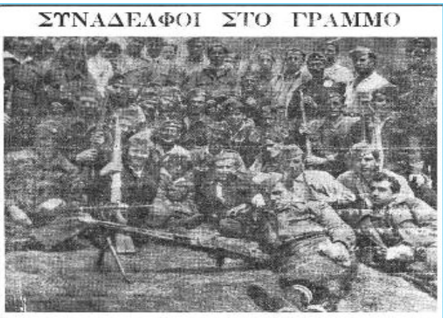
Ναυτεργάτες στο Γράμμο (από το περιοδικό «Ναυτεργάτης»). Στη λεζάντα αναγράφονται τα καράβια στα οποία δούλεσαν οι μαχητές πριν βγουν στο βουνό.

Ακολουθήσαν το κάλεσμα του Κόμματος και βρέθηκαν στα βουνά για να βάλουν το δικό τους λιθαράκι και να κτιστεί το μεγάλο οικοδόμημα του ΔΣΕ κατά της αστικής τάξης και του αστικού στρατού, κατά των Αμερικάνων ιμπεριαλιστών που είχαν διαδεχθεί τους Εγγλέζους, για να ζήσει ο λαός μας καλές μέρες.