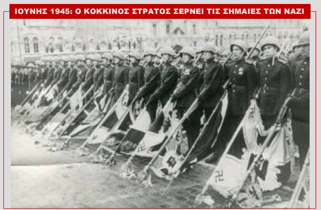
ΙΟΥΝΗΣ 1945: Ο ΚΟΚΚΙΝΟΣ ΣΤΡΑΤΟΣ ΣΕΡΠΕΙ ΤΙΣ ΣΗΜΑΙΕΣ ΤΩΝ ΝΑΖΙ

Η λαϊκή πείρα αποδεικνύει ότι η κλιμάκωση του αντικομμουνισμού και όλων των παραγόμενων αντιδραστικών ιδεολογημάτων, αποτελεί μόνο προπομπό νέων αντιλαϊκών μέτρων και περιστολής των λαϊκών δικαιωμάτων, εξαπόλυσης νέου γύρου ιμπεριαλιστικών πολέμων και επεμβάσεων σε βάρος των λαών.