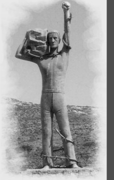
(Συνέχεια στη σελίδα 3)

Αυτές τις αμέτρητες θυσίες, όπως και όλη την ηρωική Ιστορία του Κόμματος, τίμησε με την παρουσία του πλήθους κόσμου στην εκδήλωση - επίσκεψη, που διοργανώθηκε, την Τρίτη 6 Σεπτέμβρη, από τις Κ.Ο. Αττικής του ΚΚΕ και της ΚΝΕ, με ομιλήτη τον ΓΓ της ΚΕ του ΚΚΕ, Δημήτρη Κουτσούμπα.