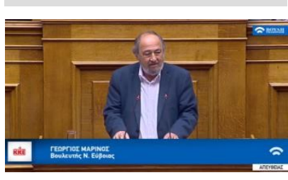
Άρθρο του Γιώργου Μαρίνου Μέλους του Π.Γ της ΚΕ του ΚΚΕ, βουλευτή του Κόμματος

οπλοστασίου και μέτρα για την ενίσχυση του ανταγωνισμού με τη Ρωσία και την Κίνα.