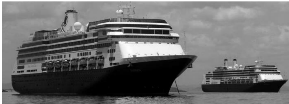
Της Κ. Μ., μέλος του πληρώματος στο κρουαζιερόπλοιο «Celebrity Edge»

«Είμαι μέλος του πληρώματος «Celebrity Edge», σε ένα από τα 46 κρουαζιερόπλοια με περίπου 50 χιλιάδες ναυτεργάτες που βρίσκονται σε αγκυροβόλια στην Φλόριντα και Μπαχάμες και νιώθω την ανάγκη να γράψω για τη ζωή των ναυτεργατών στις ειδικές - προτόγνωρες συνθήκες διασποράς της πανδημίας του κορωνοϊού στα καράβια. Αλλά και για τους άλλους 50.000 ναυτεργάτες που είναι ξέμπαρκοι αρκετούς μήνες - ανερργοί στα σπίτια τους, αβέβαιοι πότε και αν θα ξαναγυρίσουν στο πόστο τους στα καράβια. Αλλά ας πιάσω από την αρχή το νήμα για τις εξελίξεις στα κρουαζιερόπλοια: