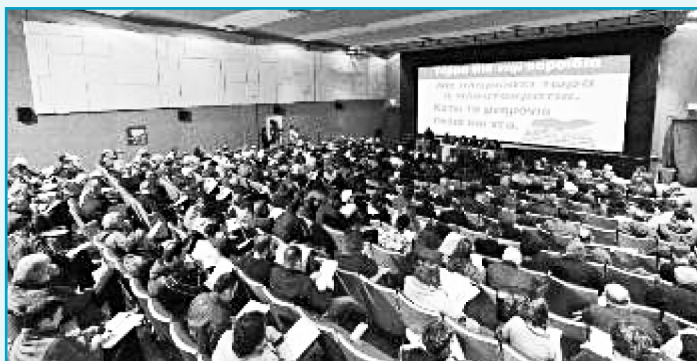
Από τη συνεδρίαση της Πανελλαδικής Συντονιστικής Επιτροπής του ΠΑΜΕ

Να φτάσει παντού στους χώρους δουλειάς, με συμμετοχή των εργαζομένων σε ανοιχτά Διοικητικά Συμβούλια, σε Γενικές Συνελεύσεις, με συσκέψεις, με πολύμορφες πρωτοβουλίες, καμία αναμονή, να συμβάλουμε στην καλύτερη οργάνωση και ανάπτυξη αγώνων, για την ανασύνταξη του εργατικού κινήματος, ενάντια στην πολιτική του κεφαλαίου και των εκπροσώπων του, για την υπεράσπιση των αναγκών της εργατικής - λαϊκής οικογένειας.