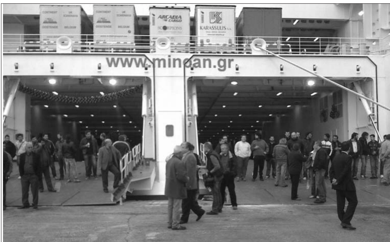
Από την παρέμβαση των Ναυτεργατικών Σωματείων ΠΕΜΕΝ - ΣΤΕΦΕΝΣΩΝ και των δυνάμεων του ΠΑΜΕ στο Ε/Γ - Ο/Γ πλοίο «CRUISE EUROPA» στο λιμάνι της Πάτρας.

πλοία. Οι ΜΙΝΩΙΚΕΣ με τον μεγαλομέτοχο GRIMALDI, ανατρέπουν το εργασιακό STATUS με το Ε/Γ- Ο/Γ πλοίο "CRUISE EUROPA" στην Πάτρα, ενώ χαρακτηριστικές είναι οι δηλώσεις της Ένωσης Επιχειρήσεων Ακτοπλοΐας (15-10-2009) ότι: "το σήμερα ισχύουν καθεστώς του Ε/Γ-Ο/Γ "CRUISE EUROPA", μας βρίσκει σύμφωνους. Ή όλοι ή κανένας !! Ή είμαστε ίσοι ως ευρωπαίοι στις υποχρεώσεις και τα δικαιώματα ή όχι!!" , που πυροδοτεί γενικότερες εξελίξεις και ανακατατάξεις σε όλα τα επιβατηγά πλοία.