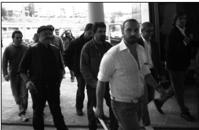
Μέλη της Συντονιστικής Επιτροπής και καθηγητές του ΚΕΣΕΝ Μηχανικών μαζί με το Προεδρείο της ΠΕΜΕΝ ενώ προσέρχονται στη συνάντησή με τον Υπουργό Εμπορικής Ναυτιλίας.

Σ' αυτές τις συνθήκες πραγματοποιήθηκε η Γενική Συνέλευση του ΚΕΣΕΝ/Μηχανικών στις 10 Σεπτέμβρη 2008, εξέτασε την κατάσταση και αποφάσισε ομόφωνα καλώντας όλους τους φορείς, να απαιτήσουν την άμεση συνάντηση με το ΥΕΝ για να δρομολογηθούν άμεσα λύσεις για την προστασία της ζωής, της ασφάλειας και λύ-