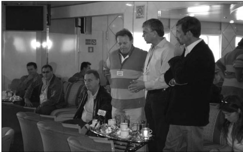
Ο Πρόεδρος του TUI-TRASPORT JOSE MANUEL OLIVEIRA σε σύσκεψη σε πλοίο της ακτοπλοΐας

• Εκτιμήθηκε θετικά η πορεία ενίσχυσης της TUI - TRANSPORT και της WFTU με νέα συνδικάτα σ'όλες τις Ηπείρους που εκπροσωπούν εκατομμύρια εργαζόμενους μέλη και η ανάγκη συνέχισης και ενίσχυσης αυτής της πορείας καθώς και του συντονισμού της δράσης τους.