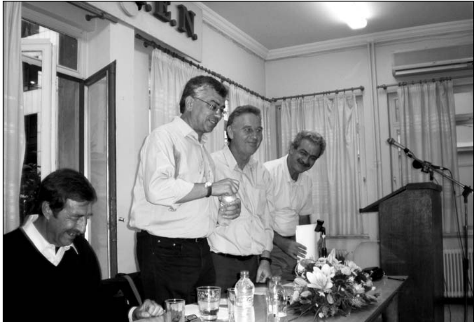
Σύσκεψη αντιπροσωπείας TUI-TRASPORT, συνδικάτων και συνδικαλιστικών στελεχών από το χώρο των Μεταφορών στα γραφεία της ΠΕΜΕΝ.

Η ITF με σχέδιο που φέρει τον τίτλο "Οργάνωση σε Παγκόσμιο επίπεδο των εργαζομένων στις Μεταφορές" έχουν δημιουργήσει ένα ολοκληρωμένο