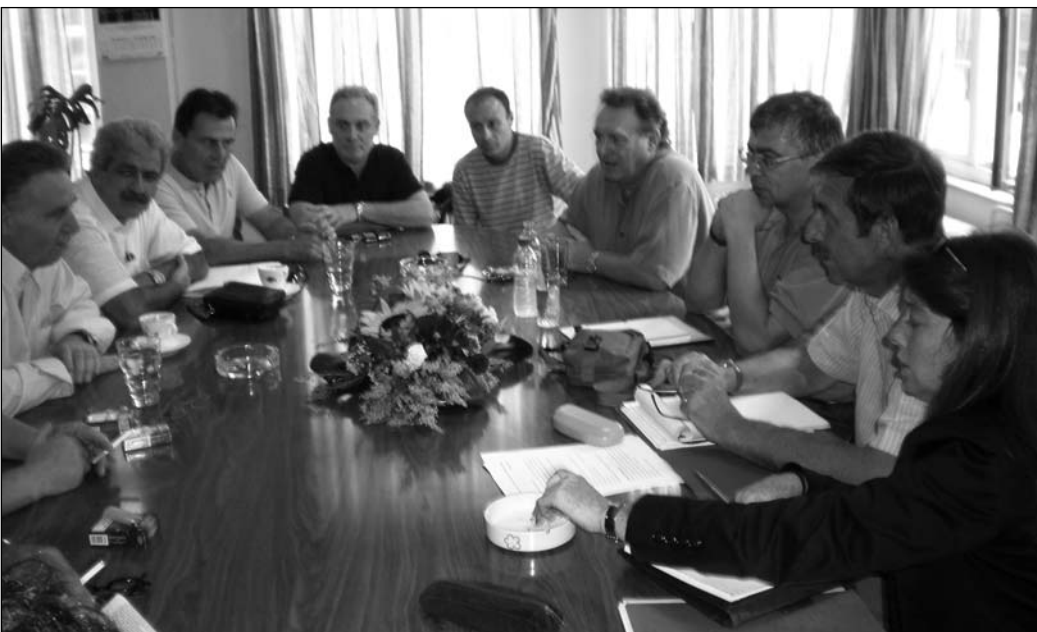
Από τη συνάντηση των σωματείων ΠΕΜΕΝ - ΣΤΕΦΕΝΣΩΝ - ΠΕΠΡΝ με την αντιπροσωπεία του TUI-TRANSPORT στα γραφεία της ΠΕΜΕΝ

Στις θαλάσσιες, αεροπορικές, σιδηροδρομικές, οδικές μεταφορές, ανατρέπονται τα εργασιακά, μισθολογικά, κοινωνικοα-