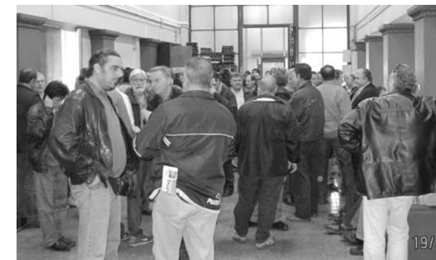
Απλήρωτοι ναυτεργάτες της G.A. FERRIES με τα προεδρεία των σωματείων PEMEN-ΣΤΕΦΕΝΣΩΝ στη συνεδρίαση του Δ.Σ. του NAT.

Η αγωνιστική κινητοποίηση συνεχίστηκε με τη μαζική συμμετοχή των ναυτεργατών στο συλλαλητήριο του ΠΑΜΕ στις 24 Νοέμβρη και κλιμακώνεται με τη συμμετοχή στην περιφρούρηση της απεργίας 17 Δεκέμβρη που αποφάσισαν τα σωματεία PEMEN - ΣΤΕΦΕΝΣΩΝ - ΠΕΠΡΝ , συντονίζοντας τον αγώνα των ναυτεργατών με το ΠΑΜΕ .