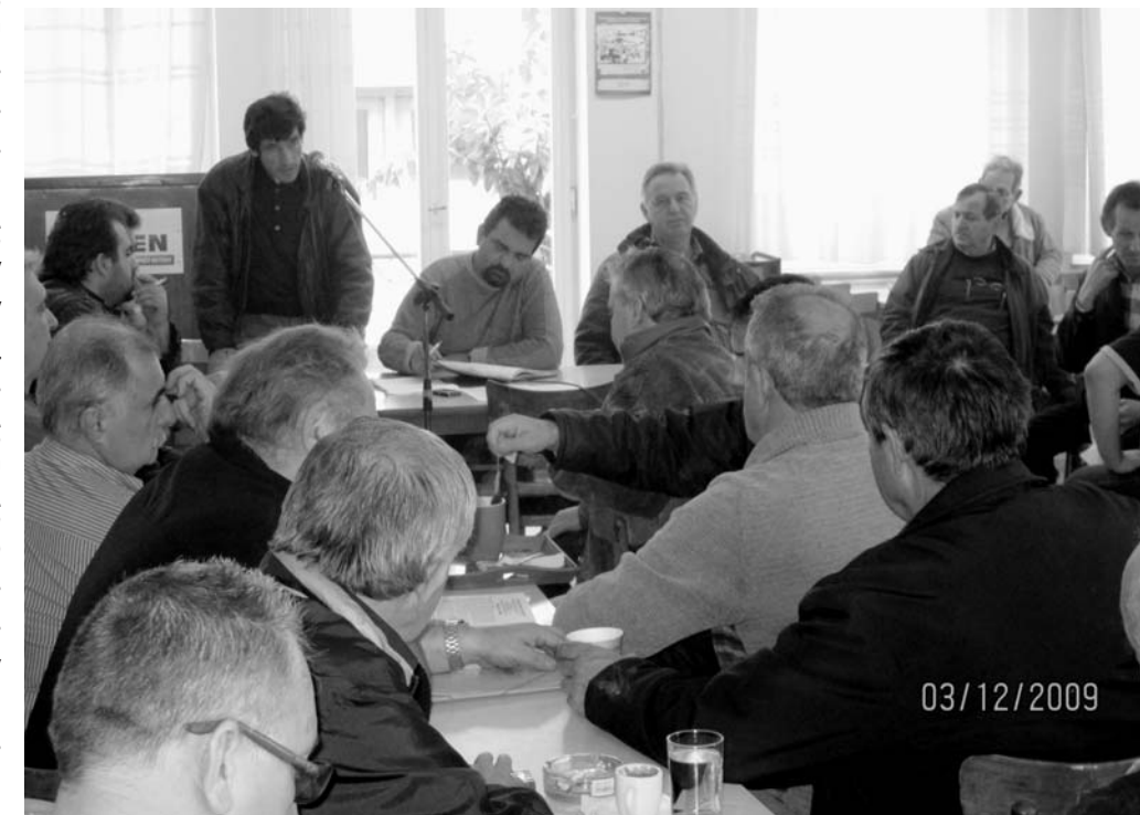
Από την σύσκεψη της Επιτροπής Ανέργων Ναυτεργατών

Υποσχεθήκαμε στους κεφαλαιοκράτες ότι όταν οι οργανωμένες φάλαγγες των εργατών διαδηλώνουν το δίκιο τους εσείς και τα φερέφωνα σας δεν θα κρυβόσαστε απλώς για να επανέλθετε σε άλλο σημείο και άλλη μέρα για να συνεχίζετε την κοινωνικά βάρβαρη αντιλαϊκή πολιτική σας, αλλά θα λακίσσετε σαν θρασύμια. Και η τρομοκρατία που εξασκείτε