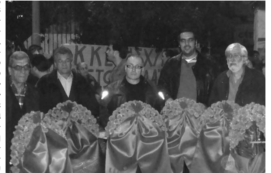
Κατάθεση στεφάνων στο Πολυτεχνείο από τις ταξικές δυνάμεις του Ναυτεργατικού Κινήματος.

Ο πιο βάρβαρος ιμπεριαλισμός που γνώρισε ποτέ η ανθρωπότητα ξεδιπλώνεται τα τελευταία χρόνια συσσωρεύοντας με τις δυνάμεις της ασύδοτης αγοράς και της νεοφιλελεύθερης λαίλαπας, από τη μια τον πιο προκλητικό πλούτο και τη φτώχεια από την άλλη. Γι αυτό, ο αγώνας συνεχίζεται. Και τότε και τώρα, δυο