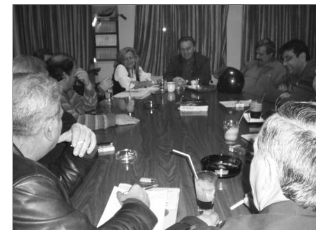
Από τη συνεδρίαση του Διοικητικού Συμβουλίου της ΠΕΜΕΝ της 3ης Δεκεμβρίου

οι εργαζόμενοι έχουμε κατακτήσει τα δικαιώματά μας και σε αυτό τον δρόμο επιβάλλεται να συνεχίσουμε, να μην προωθηθούν οι κατευθύνσεις εφοπλιστών, κυβέρνησης, Ε.Ε, με :