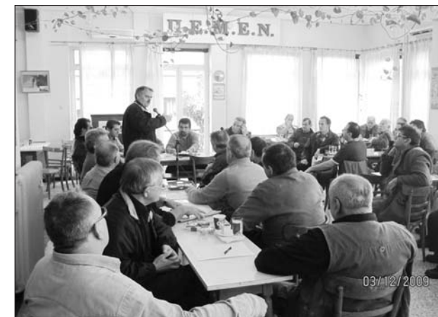
Από συνεδρίαση της Επιτροπής Ανέργων Ναυτεργατών

Με αγώνες η εργατική τάξη, οι ναυτεργάτες,