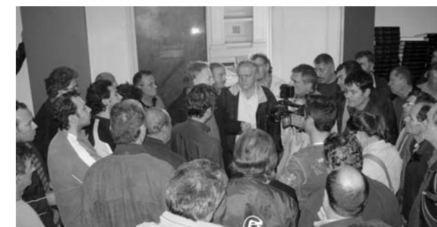
Νόμος για την προστασία των εγκαταλειμμένων ναυτεργατών

Η πάλη και συσπείρωση στα ταξικά τους συνδικάτα έφερε ένα ακόμα θετικό αποτέλεσμα. Προωθείται τροποποίηση του άρθρου 29 του νόμου 1220/81, ώστε η προστασία που προβλέπεται στο σχετικό άρθρο των ναυτεργατών που εγκαταλείπονται από εφοπλιστές στα λιμάνια του εξωτερικού, να επεκταθεί και για τους ναυτεργάτες που εγκαταλείπονται από εφοπλιστές στην ελληνική επικράτεια. Ήδη, το σχετικό σχέδιο νόμου έχει δημοσιοποιηθεί, τα ναυτεργατικά σωματεία PEMEN, ΣΤΕΦΕΝΣΩΝ και ΠΕΠΡΝ , κατέθεσαν και συμπληρωματικές προτάσεις που απαιτούν: