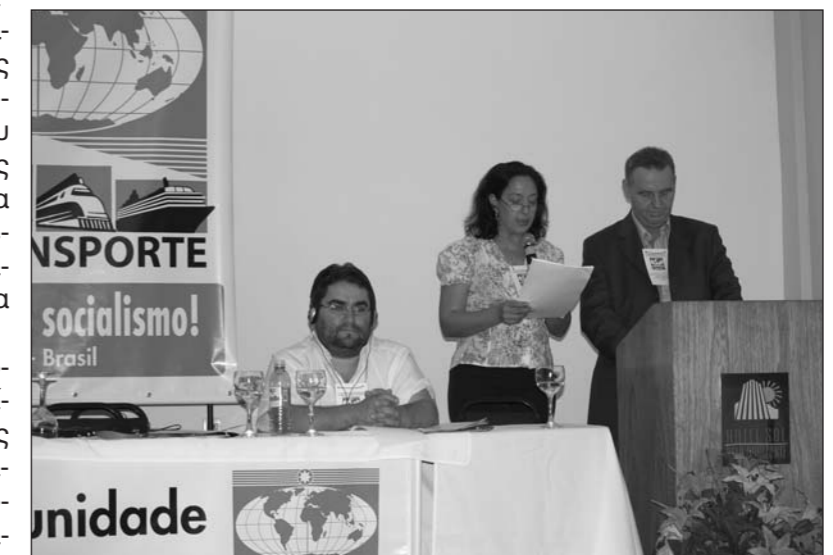
Ο Πρόεδρος Σάββας Τσιμπόγλου στο βήμα του Συνεδρίου της Διεθνούς Μεταφορών.