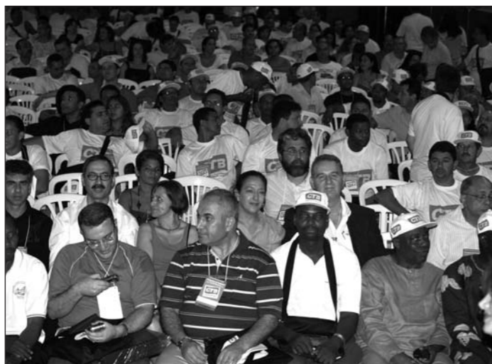
Στιγμιότυπο από το Συνέδριο της Γενικής Συνομοσπονδίας Εργατών Βραζιλίας (CTB)

ΖΗΤΩ Η ΕΝΟΤΗΤΑ ΚΑΙ ΚΟΙΝΗ ΔΡΑΣΗ ΤΟΥ ΔΙΕΘΝΟΥΣ ΤΑΞΙΚΟΥ ΣΥΝΔΙΚΑΛΙΣΤΙΚΟΥ ΚΙΝΗΜΑΤΟΣ