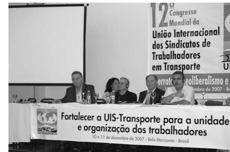
Το Προεδρείο του Συνεδρίου της Διεθνούς Μεταφορών

Στο ναυτεργατικό συνδικαλιστικό κίνημα στην Ελλάδα οι ταξικές δυνάμεις αντιστέκονται, διεκδικούν, προσπαθούν να οργανώσουν την πάλη των ναυτεργατών σε συντονισμό με τα άλλα τμήματα