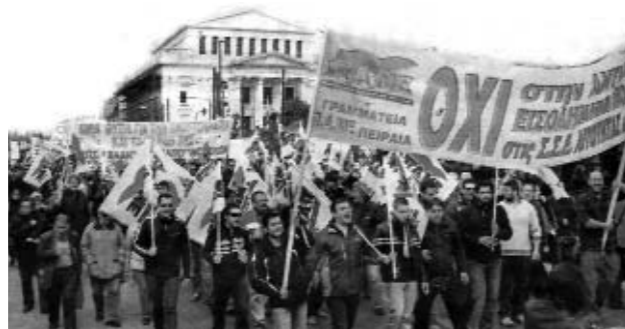
Απεργία ΠΑΜΕ 29 Μάρτη 2007

Με αυτήν την προοπτική και με μεγαλύτερη αισιοδοξία, προσφορά και απαιτητικότητα βαδίζουμε προς τον γιορτασμό της Εργατικής Πρωτομαγιάς βάζοντας τολμηρούς στόχους για την οργάνωση και την κινητοποίηση περισσότερων δυνάμεων.