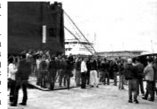
24ωρη απεργία στα Ro-Ro