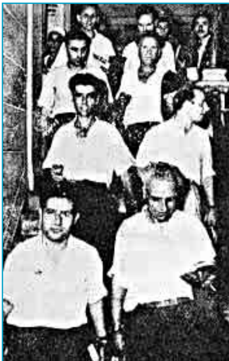
Από τη δίκη της ΟΕΝΟ

Το 1947, με βάση τον αναγκαστικό νόμο 509 η ΟΕΝΟ τέθηκε εκτός νόμου, έκλεισαν τα γραφεία στον Πει-