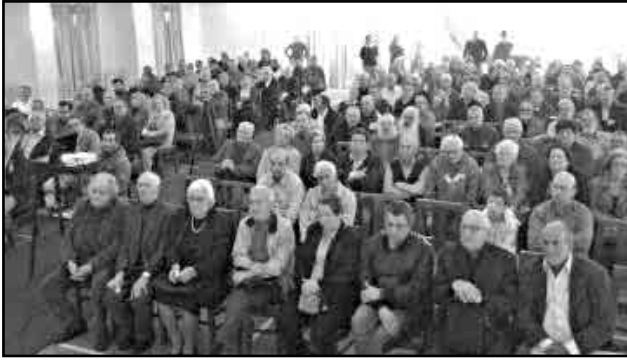
Από την εκδήλωση για τα 71 χρόνια από την ίδρυση της ΟΕΝΟ

τάξης, βρίσκεται πίσω από πολλές κατακτήσεις και για το λόγο αυτό η αστική τάξη το χτυπάει, το συκοφαντεί με κάθε τρόπο.