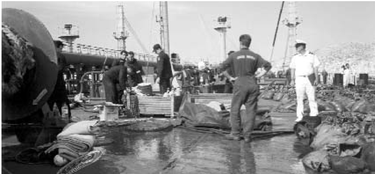
Ένα ακόμα θανατηφόρο ατύχημα εις βάρος των εργαζομένων στο Δ/Ε SAILOR, όπου χάθηκαν 5 μεταλλεργάτες

Καταλήγοντας ο Σπ.Δρίβας επισήμανε ότι: "Η ουσιαστική βελτίωση των συνθηκών εργασίας απαιτεί τη συσπείρωση των εργαζομένων στο ταξικό συνδικαλιστικό κίνημα για την εκπλήρωση όχι μόνο της ι-