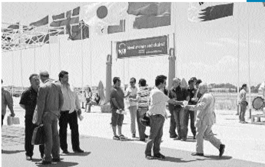
Παρέμβαση των συναδέλφων στο ΚΕΣΕΝ με το Προεδρείο της ΠΕΜΕΝ στα "Ποσειδώνια 2006".

Στην ίδια κατεύθυνση για την λειτουργία των ιδιωτι-