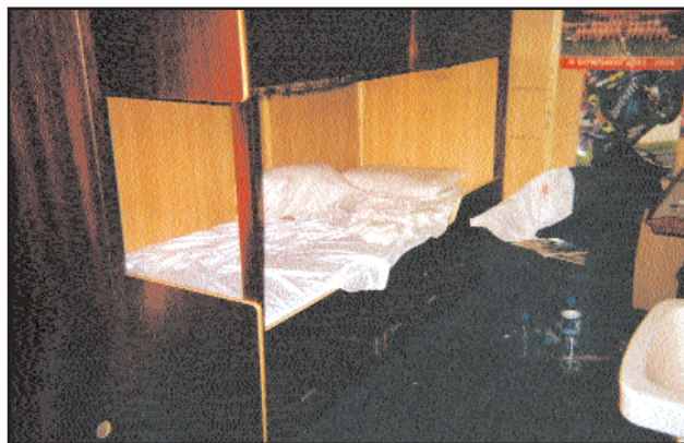
Οι άθλιες συνθήκες ενδιαίτησης του πληρώματος του Ε/Γ-Ο/Γ "ΡΟΜΙΛΑΝΤΑ" ΚΑΤΩ ΑΠΟ ΤΟ ΓΚΑΡΑΖ!!!

Καλούμε τους ναυτεργάτες να συσπειρωθούν γύρω από τις διοικήσεις των σωματείων ΠΕΜΕΝ - ΣΤΕΦΕΝΣΩΝ και τις ταξικές δυνάμεις του ναυτεργατικού συνδικαλιστικού κινήματος για την ανατροπή των υποτακτικών συνδικαλιστών στους εφοπλιστές, μέσα από την ανάπτυξη αγώνων για την υπεράσπιση και διεκδίκηση των ναυτεργατικών δικαιωμάτων.