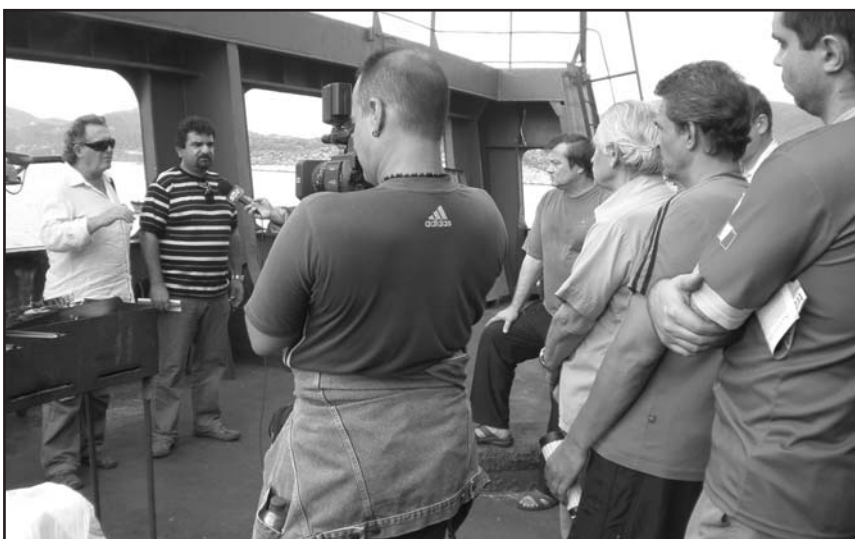
Το Προεδρείο της ΠΕΜΕΝ κοντά στους εγκαταλειμμένους ναυτεργάτες του πλοίου «CAPTAIN VALENTIN K».

Αυτό είναι ο εργασιακός μεσαίωνας του καπιταλι-