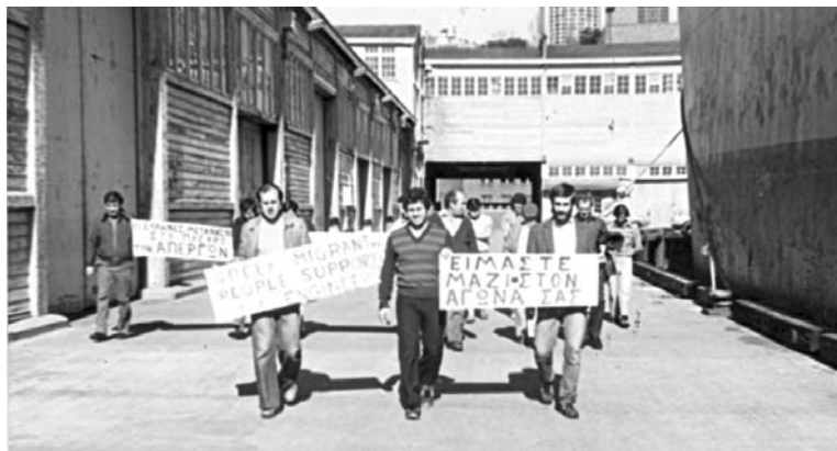
Συμπαράσταση ναυτεργατών και εργαζομένων Αυστραλών σε απεργία της ΠΕΜΕΝ

Με τη διάσπαση που έγινε στο ΚΚΕ το 1968 την αποχώρηση της διασπαστικής ομάδας και την επέκταση της διάσπασης στον αντιδικτατορικό αγώνα τόσο στην Ελλάδα όσο και στο εξωτερικό μαζί και στην Ελληνική παροικία της Αυστραλίας, οι ναυτεργάτες το 1969 προσκά-