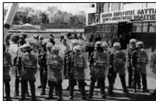
Χημικά και δακρυγόνα από τις δυνάμεις καταστολής

Στην ίδια ρότα συνεχίζουν μέχρι και σήμερα οι εργάτες της Ναυπηγοεπισκευαστικής Ζώνης μαζί με εργάτες άλλων κλάδων σε στεριά και θάλασσα μέχρι να πληρώσουν οι εφοπλιστές και οι μπιστικοί τους για το έγκλημα και για να ικανοποιηθεί το σύνολο των αιτημάτων τους για μέτρα υγιεινής και ασφάλειας στους τόπους δουλειάς.