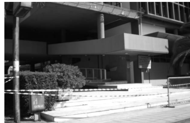
Ακατάλληλο από τους σεισμούς κρίθηκε το κτήριο του Λιμεναρχείου της Πάτρας

Διαπιστώνεται ότι στα πλοία που δρομολογούνται στα ανώτερη λιμάνια αποτέλεσμα της αντιναυτεργατικής αντιλαϊκής πολιτικής είναι να παραβιάζονται οι Συλλογικές Συμβάσεις Εργασίας, η Διεθνής Σύμβαση 180 (καθορισμός χρόνου εργασίας - ανάπαυσης) οι οργανικές συνθέσεις, διευρύνεται το καθεστώς με ναυτεργάτες χαμηλόμισθους - ανασφαλιστους - χωρίς συνδικαλιστικά δικαιώματα, υπονομεύεται η ασφάλεια ναυτεργατών, επιβαινόντων, πλοίων, με την ανοχή και συμμετοχή της πλειοψηφίας της ΠΝΟ. Αυτοί που υπογράφουν Συλλογικές Συμβάσεις Εργασίας με αυξήσεις κοροϊδίας 6%, συμμετέχουν και συμβάλλουν στην παραβίαση τους, αποτελούν την σκοτεινή πλευρά του "μαύρου" μετώπου YEN, εφοπλιστών, κυβερνητικών - εργοδοτικών συνδικαλιστών. Επίσης αποτέλεσμα της αντιναυτεργατικής πολιτικής είναι η διαρκής διόγκωση των ελλειμμάτων του NAT με τις πενιχρές συντάξεις, την πολύμηνη καθυστέρηση καταβολής των εφ'άπαξ, την υπονόμευση της ιατροφαρμακευτικής περίθαλψης, τα επαισχύοντα επιδόματα για άνεργους.