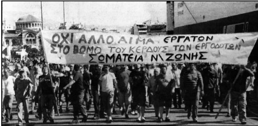
Από την πορεία και συγκέντρωση στο YEN

ΤΩΝ ΣΤΟ ΒΟΜΟ ΤΟΥ ΚΕΡΔΟΥΣ ΤΩΝ ΑΦΕΝΤΙΚΩΝ".