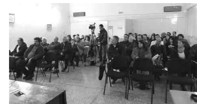
Από τη σύσκεψη στην Κεφαλλονιά