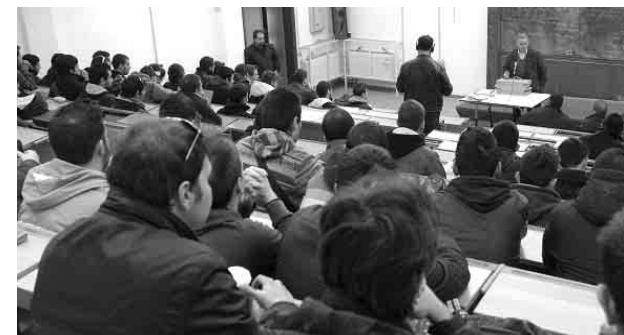
Στο Αμφιθέατρο της ΑΕΝ Ασπροπύργου

Ο Σπουδαστικός Σύλλογος της ΑΕΝ/Ιονίων Νήσων παρέδωσε πλαίσιο αιτημάτων το οποίο παραθέτουμε.