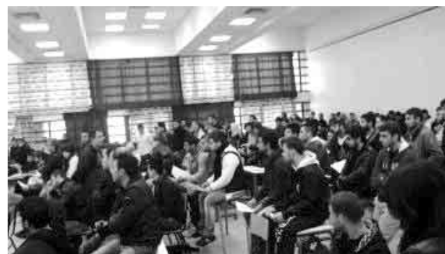
Στο Αμφιθέατρο της ΑΕΝ Κρήτης

Με τιμή, Σπουδαστές Ιονίων Νήσων Προβλήματα στην Ακαδημία μας