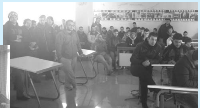
Επίσκεψη στην ΑΕΝ Χίου στις 16 Γενάρη