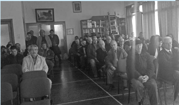
Κοπή της πίτας και εκδήλωση για τα παιδιά των Μηχανικών στη Χίο στις 15 Γενάρη