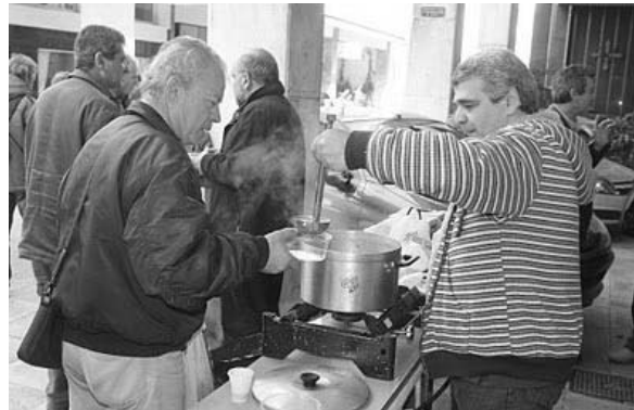
Στιγμιότυπα από τις εκδηλώσεις της Επιτροπής Ανέργων Ναυτεργατών τα Χριστούγεννα, σε ΓΕΝΕ και ΟΙΚΟ ΝΑΥΤΟΥ

Ήδη στα Ποντοπόρα πλοία και τα Κρουαζιερόπλοια πάνω από 60.000 χαμηλόμισθοι, ανασφάλιστοι αλλοδαποί συνάδελφοί μας εργάζονται, με μισθούς που καθορίζονται από τα δουλεμπορικά γραφεία, με τα οποία συνεργάζονται άμεσα οι εφοπλιστές.