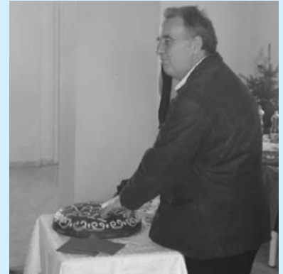
Κοπή της πίτας και εκδήλωση για τα παιδιά των Μηχανικών στη Θεσσαλονίκη στις 8 Γενάρη