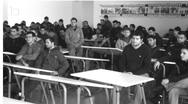
Επίσκεψη στην ΑΕΝ Χίου στις 18 Γενάρη