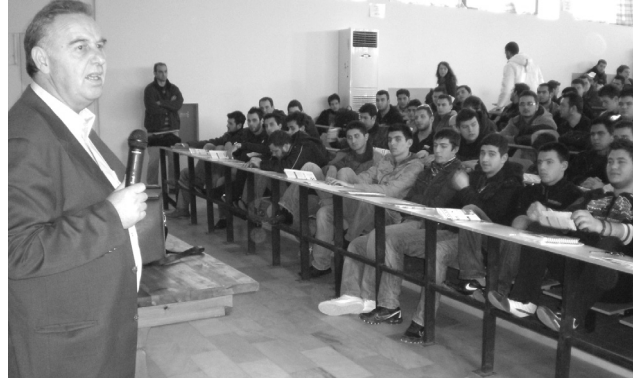
Επίσκεψη στην ΑΕΝ Μακεδονίας στις 11 Γενάρη