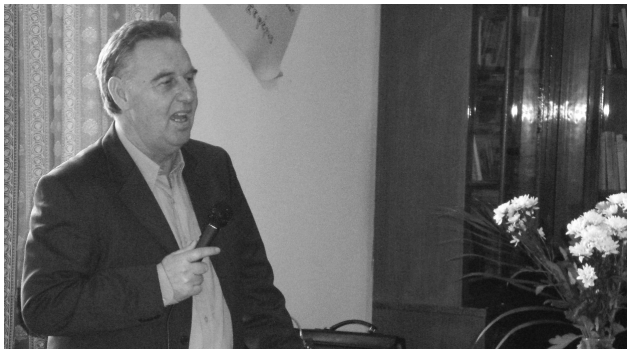
Κοπή της πίτας και εκδήλωση για τα παιδιά των Μηχανικών στη Χίο στις 17 Γενάρη