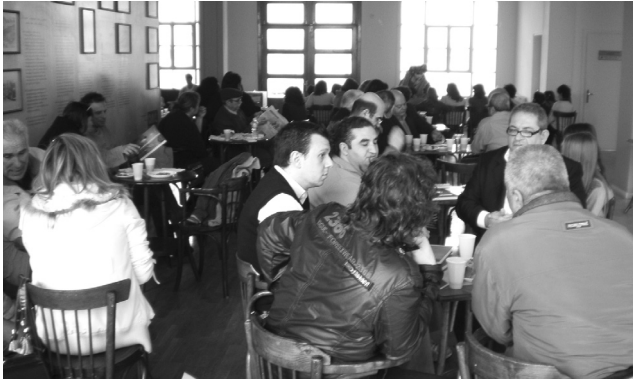
Κοπή της πίτας και εκδήλωση για τα παιδιά των Μηχανικών στη Θεσσαλονίκη στις 10 Γενάρη