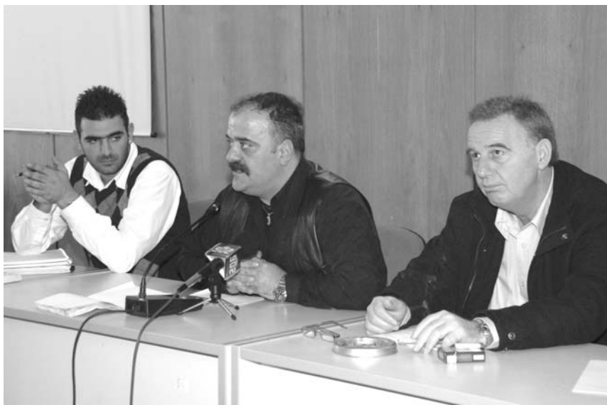
Από τη συνέντευξη τύπου στο ΚΕΣΕΝ

Η πραγματικότητα που βιώνουν καθημερινά οι σπουδαστές των ΑΕΝ και οι μετεκπαιδευόμενοι στο ΚΕΣΕΝ είναι η απαξίωση και εγκατάλειψη ακόμα και σε στοιχειώδεις λει-