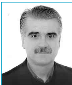
Του Γιώργου ΤΟΥΣΣΑ, μέλους της ΚΕ και ευρωβουλευτή του ΚΚΕ

Ας πάρουμε για παράδειγμα τη φορολόγηση ενός ποντοπόρου πλοίου με ελληνική σημαία, 20.000 dwt, ηλικίας 5 ετών, το οποίο λειτουργεί όλο το χρόνο. Ακόμη και στις συνθήκες της κρίσης, με ημερήσιο ναύλο 4.500