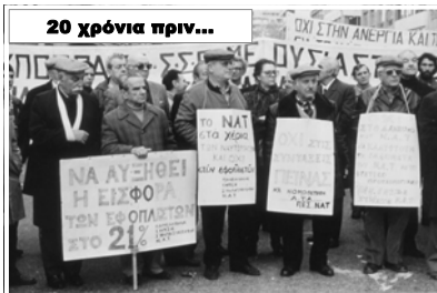
Με ταξικούς αγώνες έχουμε κατακτήσει τα δικαιώματά, που σήμερα μας αφαιρούν. Με ταξικούς αγώνες μπορεί και θα ανατραπεί η αντιλαϊκή πολιτική, που μας εξοντώνει.