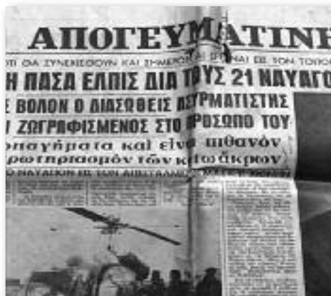
Δημοσίευμα της εποχής για το ναυάγιο του "Αίγινη"