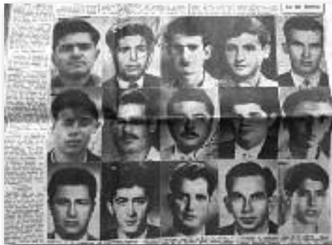
Οι ναυτικοί που χάθηκαν στο ναυάγιο της "Αίγινης" το 1963