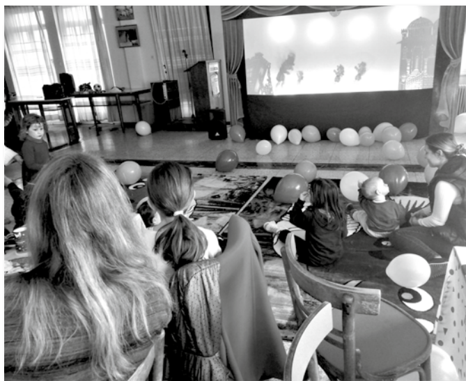
Γιορτή για τα παιδιά στον Πειραιά

Πραγματοποιήθηκαν οι προγραμματισμένες εκδηλώσεις της ΠΕΜΕΝ, με γιορτές για τα παιδιά σε Πειραιά και Χίο, περιοδείες στις ΑΕΝ Μακεδονίας, Χίου και Κρήτης, καθώς και κοπή πρωτοχρονιάτικης πίτας σε Πειραιά και Χίο.