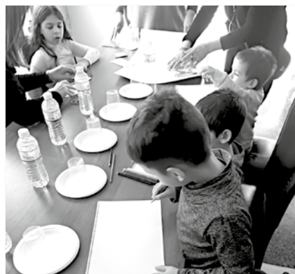
Γιορτή για τα παιδιά στη Χίο