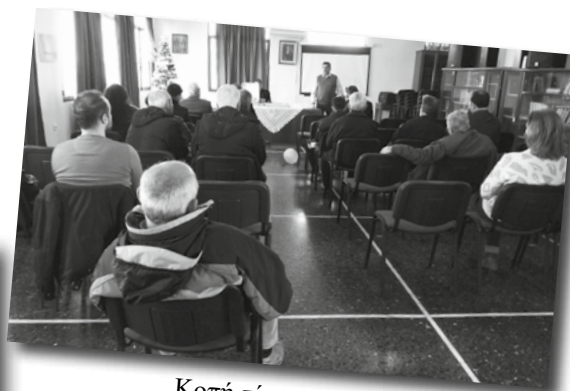
Κοπή πίτας στη Χίο