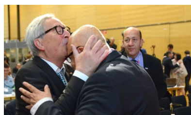
Ιδιαίτερα στενές οι σχέσεις της ΓΣΕΕ με τις ETUC - ΙΤUC (...)

Συνδικαλιστές, που στις χώρες τους δεν είχαν κάνει ποτέ ούτε μισή μέρα απεργία, έτρεχαν με βολιτσές γεμάτες (με τι άραγε) να "εκπολιτίσουν" τα συνδικάτα των αναπτυσσόμενων χωρών. Το Κατάρ είναι εξαιρετική, από ότι φαίνεται, μόνο στο ότι οι βολιτσές αυτή την φορά είχαν αντίθετη κατεύθυνση. Το σκάνδαλο για την ΕΕ είναι ότι αντί να εξαγοράζει η ΕΕ συνδικάτα, μια άλλη χώρα εξαγόρασε ένα δικό της παιδί.