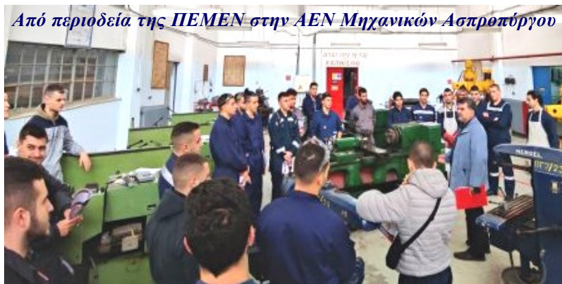
Από περιόδεϊα της ΠΕΜΕΝ στην ΑΕΝ Μηχανικών Ασπροπύργου

ΑΕΝ Ασπροπύργου, ΑΕΝ Καλύμνου, ΑΕΝ Κεφαλονιάς, ΑΕΝ Κύμης, ΑΕΝ Οινουσσών, ΑΕΝ Πρέβεζας, ΑΕΝ Σύρου, ΑΕΝ Χίου