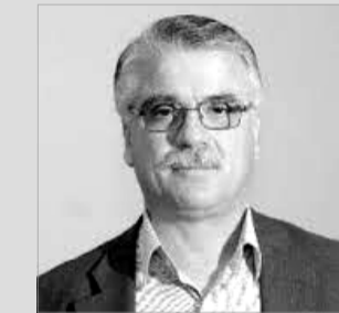
Τούσας Γιώργος, υποψήφιος ευρωβουλευτής, πρ. πρόεδρος της ΠΕΜΕΝ, μέλος της ΚΕ του ΚΚΕ και ευρωβουλευτής.

Στα ψηφοδέλτια του ΚΚΕ για τις Ευρωεκλογές, τις Περιφερειακές και Δημοτικές Εκλογές, που γίνονται στις 18 και 25 του Μάη 2014, συμμετέχουν πρωτοπόροι αγωνιστές και αγωνιστριες σε όλα τα μέλητα του αγώνα, στους τόπους δουλειάς του ιδιωτικού και του δημόσιου τομέα, στους αγώνες των αυτοαπασχολούμενων και των φτωχών αγροτών, στον τομέα των επιστημών και του πολιτισμού, της νεολαίας και των γυναικών. Περιφερειακοί και δημοτικοί σύμβουλοι δραστήριοι στην υπεράσπιση των εργατικών και λαϊκών συμφερόντων. Ευρωβουλευτές δοκιμασμένοι στην αποκάλυψη του αντιλαϊκού χαρακτήρα της Ευρωπαϊκής Ένωσης. Ανάμεσα τους δεκάδες πρωτοπόροι αγωνιστές του ταξικού ναυτεργατικού κινήματος, μεταξύ των οποίων: