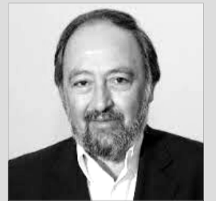
Μαρίνος Γιώργος, υποψήφιος περιφερειάρχης Στερεάς Ελλάδας, ασυρματιστής, μέλος του ΠΓ της ΚΕ του ΚΚΕ.