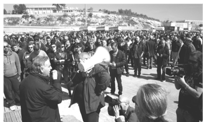
Μείναντα δικαιώματα των ναυτεργατών.

Κατά τη διάρκεια του τριήμερου απεργιακού αγώνα στον Πειραιά, ναυτεργάτες απ' όλα τα πλοία, σπουδαστές του ΚΕΣΕΝ και των ΑΕΝ, άνεργοι και συνταξιούχοι συγκεντρώθηκαν, τη Δευτέρα 31/3 και την Τετάρτη 2/4, στο «European Express» της εταιρείας ΝΕΛ, η οποία παρά τις δικαστικές αποφάσεις που την υποχρεώνει να καταβάλει άμεσα τα δεδουλευμένα έχει πολλούς μήνες να πληρώσει, και στη συνέχεια πορεύθηκαν στο υπουργείο Εμπορικής Ναυτιλίας.