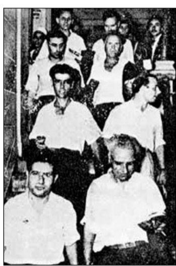
Οι 10 ναυτεργάτες συνδικαλιστές της θηλυκής ΟΕΝΟ στη δίκη του '48