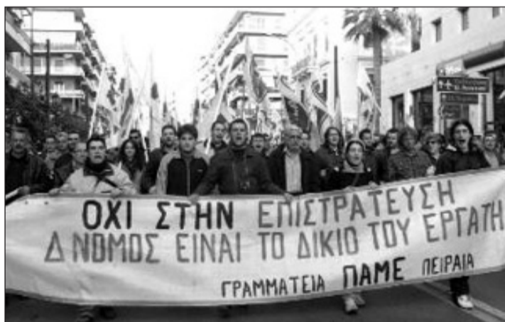
Ναυτεργάτες, σπουδαστές, συνταξιούχοι διαδηλώνουν κατά της πολιτικής επιστράτευσης το 2006 από τη ΝΑ