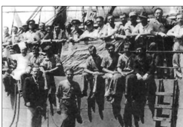
Απεργία Ναυτεργατών του πλοίου «Θεοφάνης Λιβανός» στην Αυστραλία το 1945 υπό την καθοδήγηση της ΟΕΝΟ