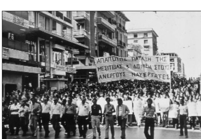
Από την πορεία των Ναυτεργατών προς το Καστρί το 1982