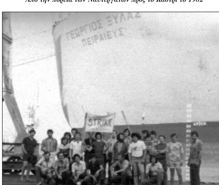
Από την παγκόσμια απεργία των Ναυτεργατών κατά τη δεκαετία του '80