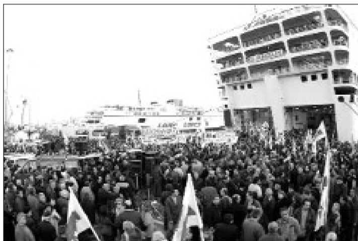
Με τη συνέχιση της απεργίας και την έκπραξη ταξική αλληλεγγύη, οι ναυτεργάτες τομάζωσαν το φύλλο πορείας της επιστράτευσης

Ο ι δυνάμεις της Ναυτεργατικής Συνδικαλιστικής Κίνησης εκτιμώντας τις συνθήκες που διαμορφώνονται στο ναυτεργατικό, εργατικό κίνημα, διαπιστώνουν την βάρβαρη επίθεση σε βάρος των δικαιωμάτων των ναυτεργατών, των εργαζομένων, αποτέλεσμα της αντιναυτεργατικής - αντιλαϊκής πολιτικής των μέχρι σήμερα κυβερνήσεων που υπηρετεί την κερδοφορία και την ανταγωνιστικότητα του κεφαλαίου.