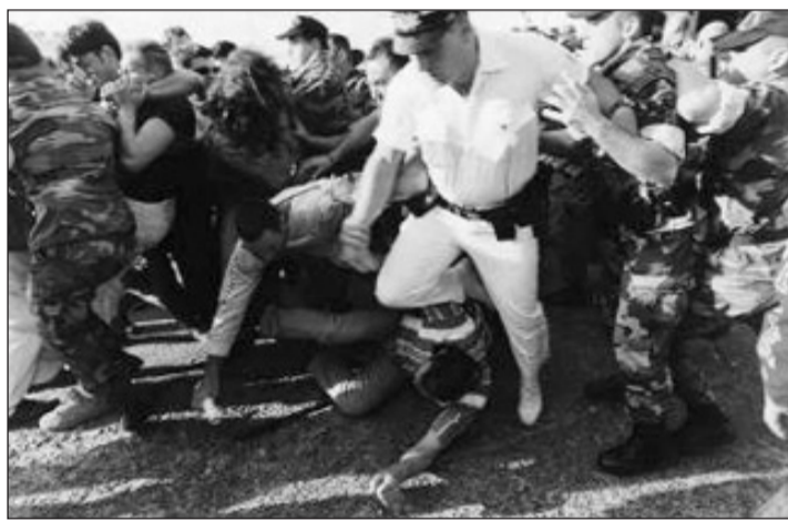
Οι δυνάμεις καταστολής επιτίθενται στους απεργούς ναυτεργάτες, επί κυβερνήσεως ΠΑΣΟΚ το 2002