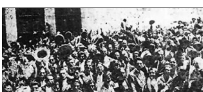
Απεργία των Ναυτεργατών στις 10 Ιούνη του 1927