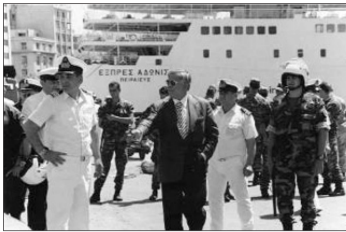
Ο εφοπλιστής Αγούδημος καθοδηγεί προσωπικά τις δυνάμεις καταστολής στο μακελειό