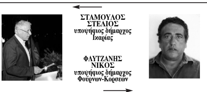
ΣΤΑΜΟΥΛΟΣ ΣΤΕΛΙΟΣ υποψήφιος δημάρχος Ικαρίας