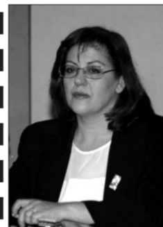
ΕΛΠΙΔΑ ΠΑΝΤΕΛΑΧΗ υποψήφια δήμαρχος Πειραιά