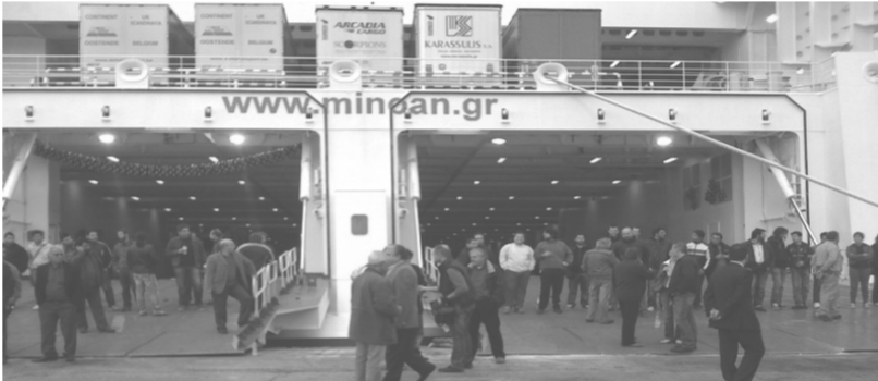
Μπλόκο στους καταπέλτες του «CRUISE EUROPA» 15 Οκτωβρίου 2009

Οι διοικήσεις των σωματείων PE MEN-ΣΤΕΦΕΝΣΩΝ, καθόρισαν προγράμμα δράσης με περιοδείες σε λιμάνια και ναυτοπόρους, για την οργάνωση-συσπείρωση-προετοιμασία του απεργιακού αγώνα.