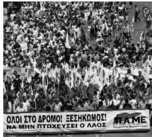
Με τον νόμο του Μνημονίου (3845/2010) και τον νέο αντιασφαλιστικό νόμο (3863/2010):

1) Νέο ασφαλιστικό. 2) Νόμο για την αναμόρφωση του συστήματος συλλογικών διαπραγματεύσεων (κατάργηση Συλλογικών Συμβάσεων). 3) Τροποποίηση της νομοθεσίας για την προστασία της εργασίας. 4) Αύξηση του τιμολογίου της ΔΕΗ από 40 έως 100%. 5) Άμεση μετάταξη μέσα στο 2010 πολλών προϊόντων λαϊκής κατανάλωσης, τρόφιμα, φάρμακα από τον χαμηλό συντελεστή 11% στον ψηλότερο 23% κ.ά. (Συνέχεια στη σελ. 2)