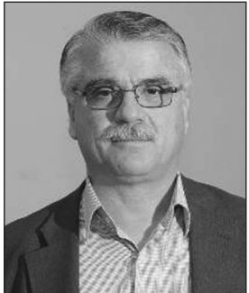
Μέλος της ΚΕ του ΚΚΕ, ευρωβουλευτής του ΚΚΕ, Πρόεδρος της ΠΕΜΕΝ την περίοδο 1997-2004 και της Γραμματείας του ΠΑΜΕ 1999-2004.