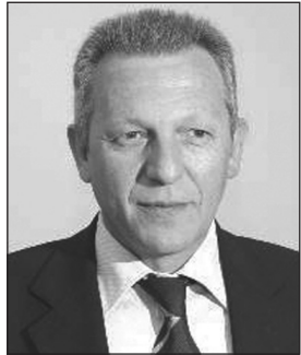
Μέλος της ΚΕ του ΚΚΕ, ευρωβουλευτής του ΚΚΕ, Γενικός Γραμματέας του Παγκόσμιου Συμβουλίου Ειρήνης από το 2000.